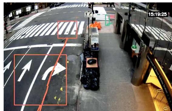
Un video secuencial recopilado por los sensores de Numina revela patrones de distanciamiento social en las calles de la ciudad de Nueva York.