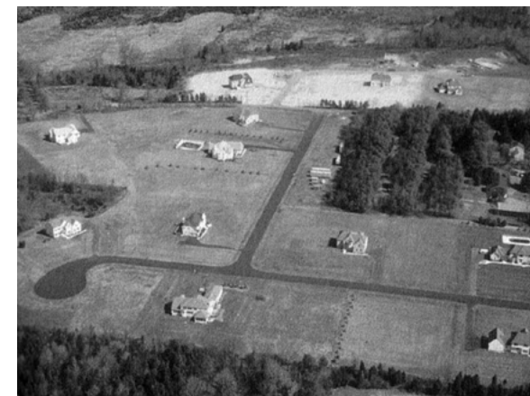
Terrenos grandes en el municipio de Franklin, Nueva Jersey (izquierda), y terrenos pequeños en la favela Matinha, Rio de Janeiro (derecha).